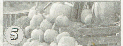
5 Домашнее хозяйство - работы в ноябре на участке, в саду и огороде