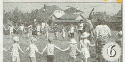
6 Клуб "Форсаж" - есть такие автомоделлисты! Ребята из Приморского показали класс в Федерации технического творчества