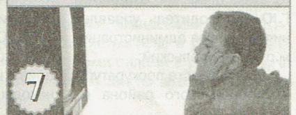
7 Как родителям отслеживать возрастные маркеры на телевидении? Что это такое и как теперь быть