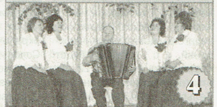
4 Народному ансамблю "Нежность" - 15 лет. Артисты поселка Приморский радуют уже не одно поколение. 17 ноября состоится юбилейный концерт.