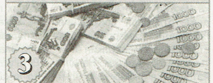
3 Объем доходов Самарской области увеличат на 700 миллионов рублей: решение комитета по бюджету, финансам, налогам, экономической и инвестиционной политике Самарской Губернской Думы