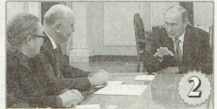
2 Встреча Президента с губернатором: Путин и Меркушкин обсуждали развитие Самарской области