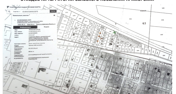
Приложение №1 к постановлению Администрации сельского поселения Приморский от 12.02.2020 г. № 66 СХЕМА РАЗМЕЩЕНИЯ МЕСТ (ПЛОЩАДОК) НАКОПЛЕНИЯ ТВЕРДЫХ КОММУНАЛЬНЫХ ОТХОДОВ НА ТЕРРИТОРИИ СЕЛЬСКОГО ПОСЕЛЕНИЯ ПРИМОРСКИЙ