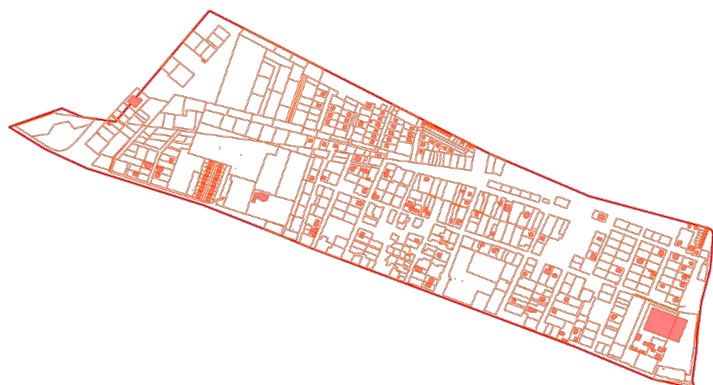
ПЛАН КАДАСТРОВОГО КВАРТАЛА 63.32.2501003